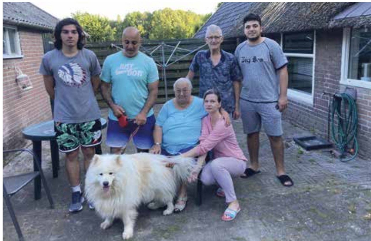
De familie Meijering met hun gasten.

Samir: "Het is nog lang niet veilig genoeg om terug te gaan. Voorlopig zullen we blijven." Jan en Sara: "Mooi dat we op onze leeftijd nog iets voor een ander kunnen betekenen."