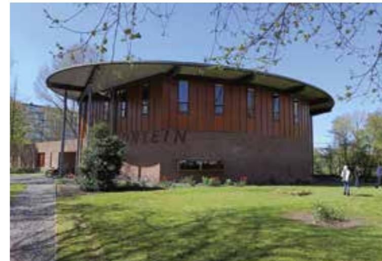
De Fonteinkerk in Groningen, waar in september een huisartsenpraktijk haar deuren opent in het kerkgebouw.

Soms begint een gemeente zelf met een pioniersplek, soms komt er een verzoek van een plek of ze zich aan jullie gemeente mogen verbinden. Het lijkt wel alsof dat grote verschillen zijn, maar in de praktijk hoeft dat helemaal niet zo te zijn. In beide gevallen vraagt het onderhouden van de relatie tijd, en moeite.