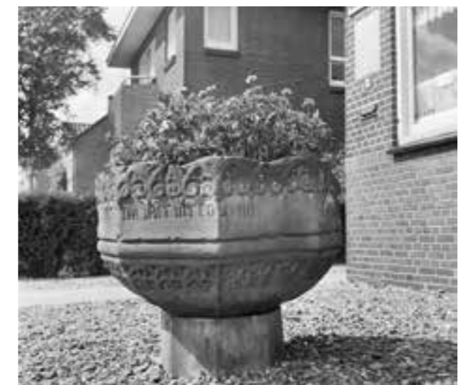
Doopvont van Onstwedde in 1967.

Dit artikel verscheen eerder in Kerk in Stad , nummer 12 van 2022.