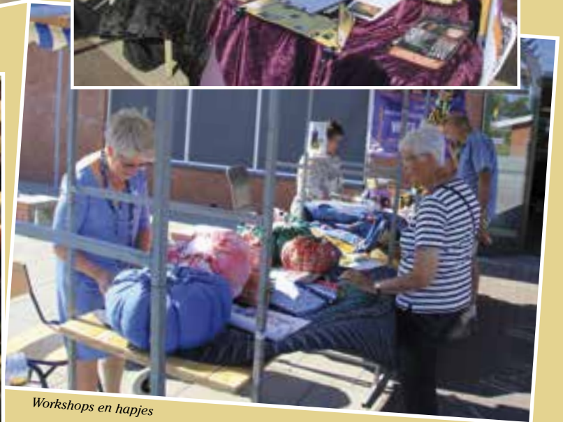
Workshops en hapjes