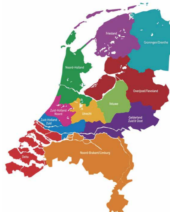
Classisindeling Protestantse Kerk in Nederland