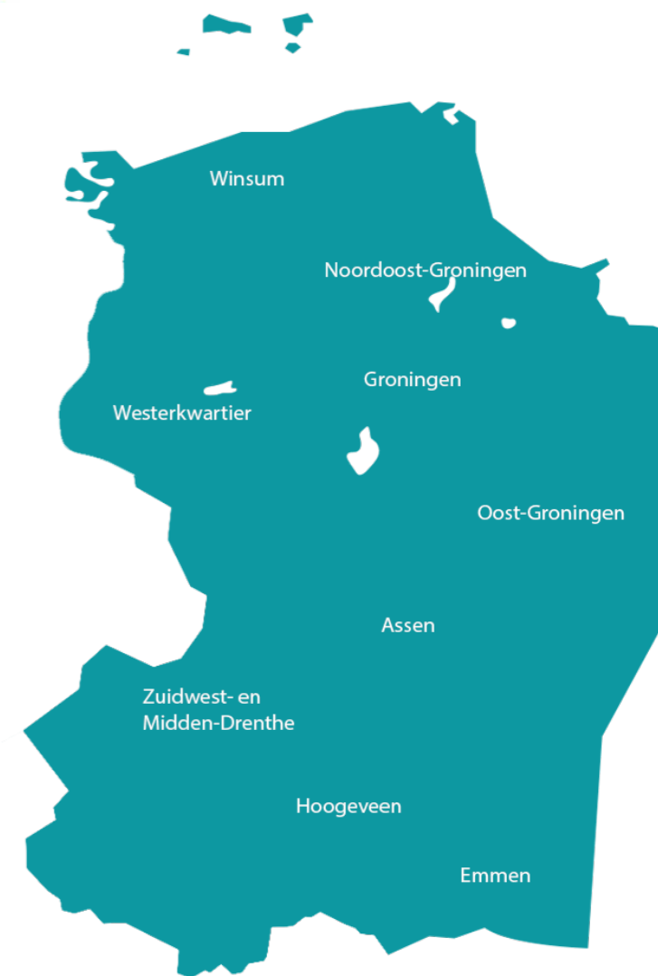
Ringen van de Classis Groningen-Drenthe