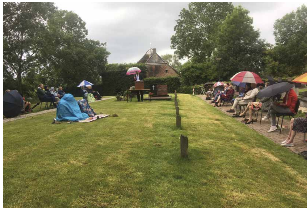
Openluchtdienst van de HG Dorkwerd.

Als leden van de Protestantse Kerk in Nederland hebben we elkaar veel te bieden, klein en groot, groot en klein. Er is veel te doen in onze gemeentes en er zijn zo veel mensen bijzonder betrokken. Dat kunnen we nog beter benutten en ik zou willen dat we proberen misschien niet in het centrum van de wereld of levens van mensen te staan, maar tenminste daarin zichtbaar van betekenis te kunnen zijn. Dat kunnen we het beste samen, denk ik.