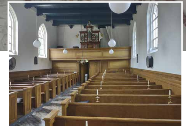
De kerk van Nieuw-Scheemda.

en harmonieus. Het was er stil – wij waren de enige bezoekers op dat moment. We kwamen even tot rust.