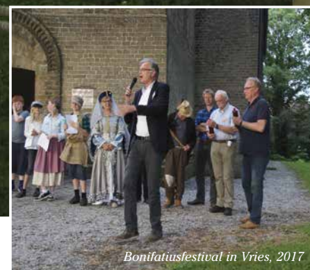
Bonifatiusfestival in Vries, 2017

vakantiespeldagen, om een paar voorbeelden te noemen. Als kerkelijke gemeente zoeken we, waar mogelijk, actief de samenwerking.