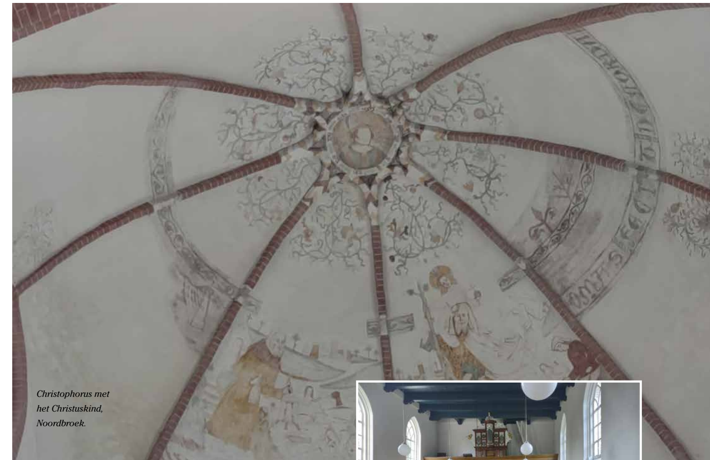
Christophorus met het Christuskind, Noordbroek.

Wij fietsten verder, via een mooie route, naar de zaalkerk in Nieuw-Scheemda. Die is nu in bezit van de Stichting Oude Groninger Kerken. Ik houd wel van dit soort kerken: sober