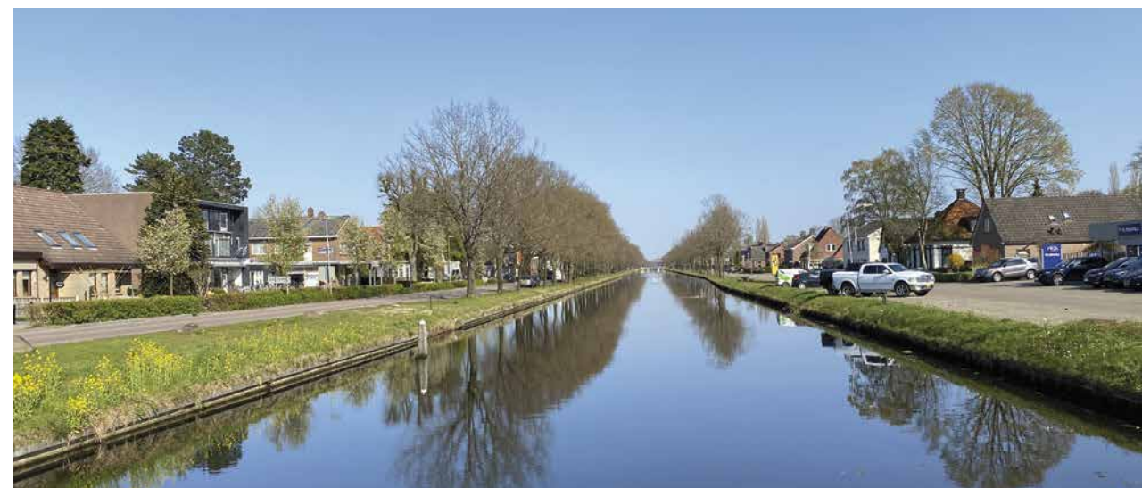
De Hoogeveense Vaart

Ons eerste concrete idee was een gezamenlijke startzondag in september 2020. Ondanks de coronabeperkingen kon dit prima doorgang vinden. Mensen gingen op de fiets of met