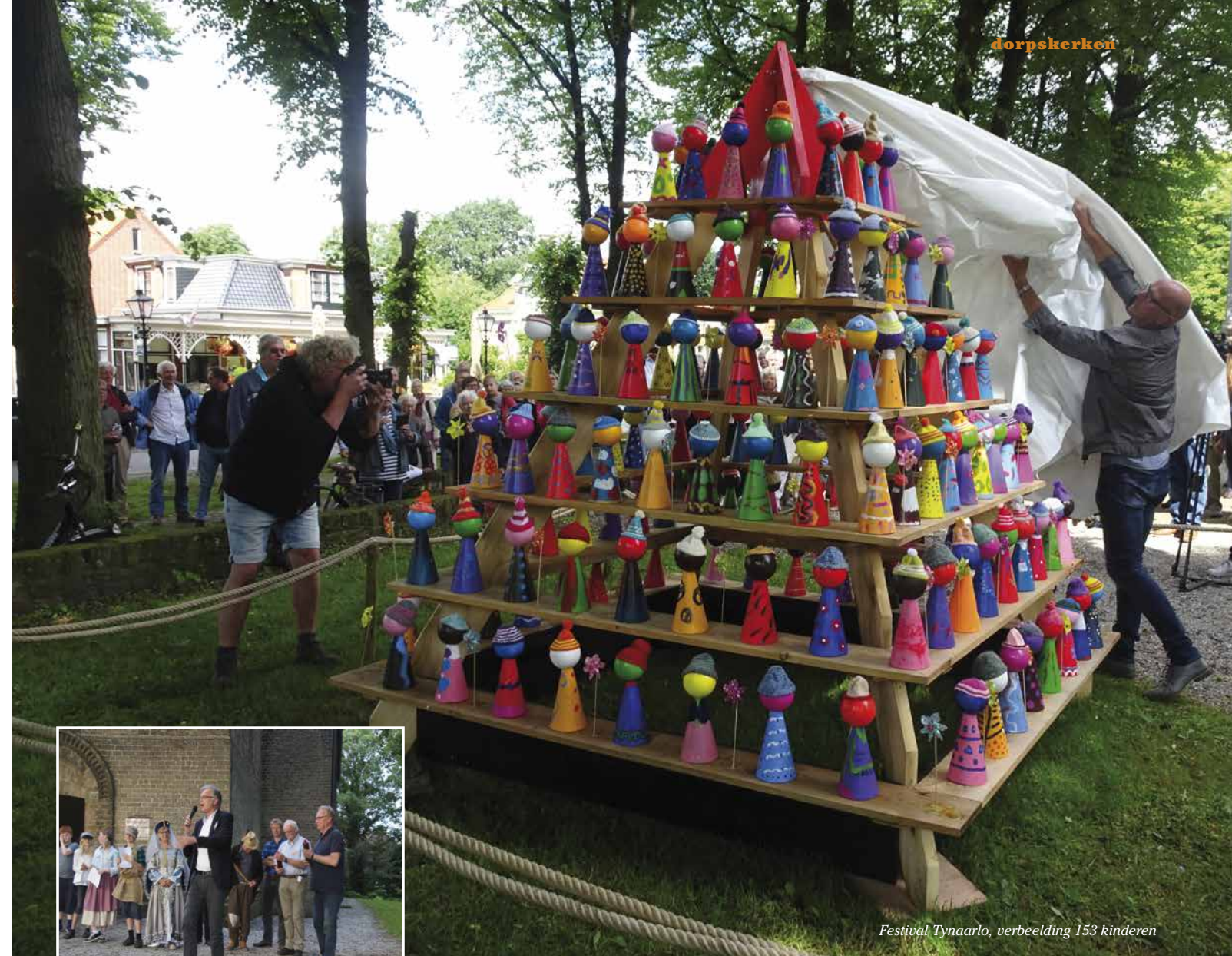
Festival Tynaarlo, verbeelding 153 kinderen